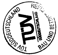
Rubr. 2 links / Col. 2 left (M 1:5)

- GEPRÜFT - TÜV Süddeutschland Bau und Betrieb GmbH Zentralabteilung Aufzüge, Sicherheitsbereiche Westendstraße 188, 8080 München Der Sachverständige